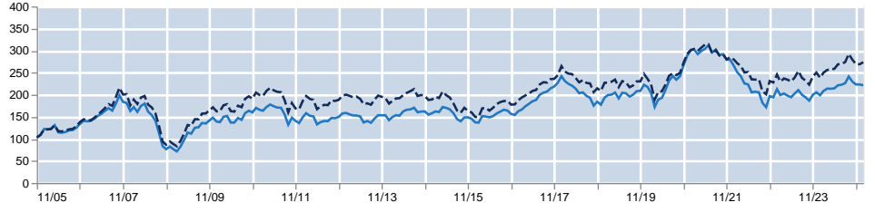
Goldman Sachs Emerging Markets Equity Portfolio Base Shares (Acc.) 6 MSCI Emerging Markets (Net Total Return, Unhedged, USD) 6

تجدر الإشارة إلى أن هذا الصندوق يُدار بصورة نشطة ولم يُصمم ليتتبع مؤشره المرجعي، مما يعني أن أداء الصندوق قد يكون مغايراً لأداء مؤشره المرجعي، هذا فضلاً عن أن عوائد المؤشر المصرح بها قد لا تشمل أي رسوم إدارة أو أي رسوم أخرى مرتبطة على الصندوق على عكس عوائد الصندوق التي تشمل تلك الرسوم. إن الأداء السابق ليس بالضرورة دليلاً على الأداء في المستقبل الذي قد يكون مختلفاً. ويجب التنويه إلى أن قيمة الاستثمارات والدخل المتحقق منها قد يتقلبان صعوداً أو هبوطاً وأن هناك احتمال خسارة رأس المال المستثمر.